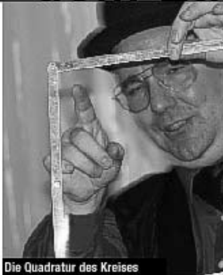
Die Quadratur des Kreises

Wie ein lustiger Schelm bietet Awano Laien und Zauberkünstlern in dieser Kombination eine Reihe von selten gesehenen Kunststücken, die sich mancher Profi wahrscheinlich gar nicht